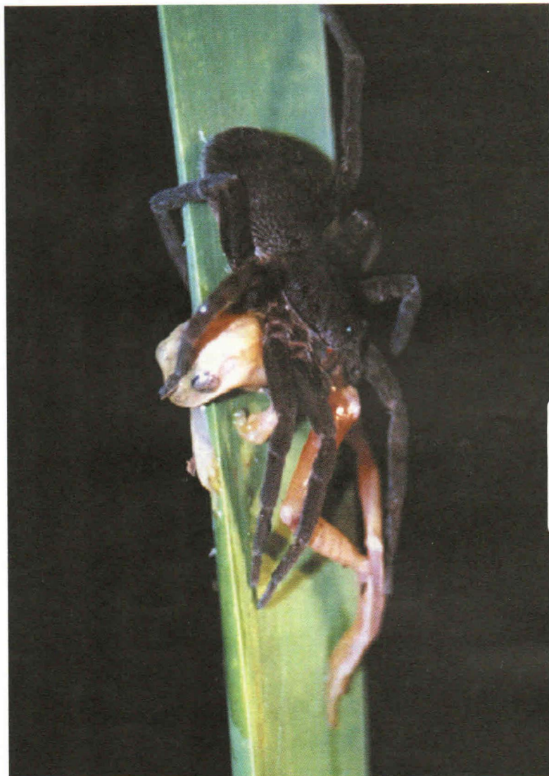
“Boia Fria” Foto Vencedora do II Concurso de Fotografias da SBET MARCELO NOGUEIRA DE CARVALHO KOKUBUM

Publicação Semestral da Sociedade Brasileira de Etologia