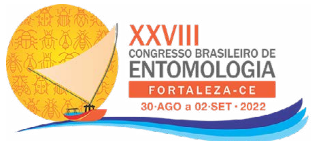
XXVIII Congresso Brasileiro Entomologia 30 agosto - 2 setembro 2022 Link: https://www.cbe2021.com.br/#