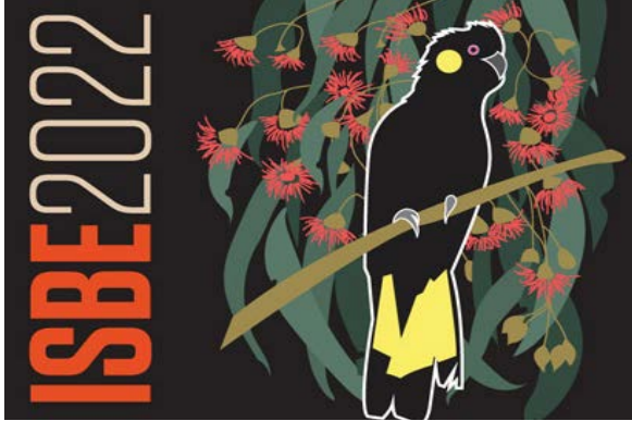
Congress of the International Society for Behavioral Ecology (ISBE) - 11- 16 setembro 2022 Link: https://www.isbe2022.com/