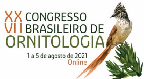
XX Congresso Brasileiro de Ornitologia 1 - 5 agosto 2021 Link: http://xxviicbo2021.com.br/event/xxviicbo/