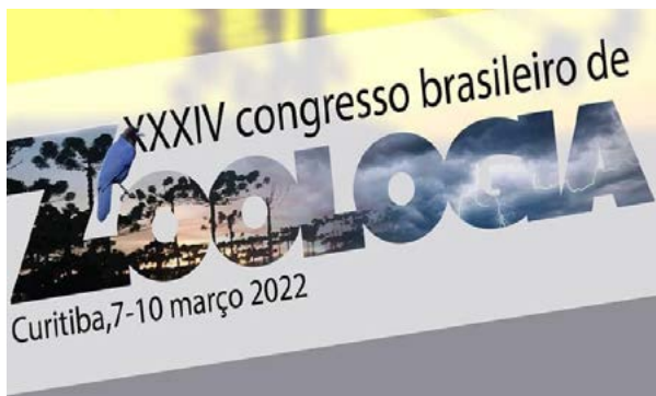
XXXIV Congresso Brasileiro de Zoologia 7 -10 março 2022 Link: https://www.cbzoo.com.br/