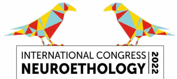
International Congress of Neuroethology 24 - 20 julho 2022 Link: https://neuroethology2020.com/