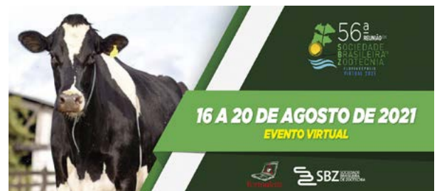
56ª Reunião Anual da Sociedade Brasileira de Zootecnia 16 - 20 agosto 2021 Link: http://sbz.org.br/reuniao2020/