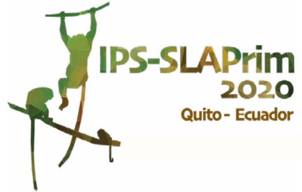
International Primatological Society 9 - 15 janeiro 2022 Link: https://ipsquito.com/