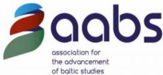
14th Conference on Baltic Studies in Europe (CBSE) - 3 - 5 junho 2021 Link: https://aabs-balticstudies .