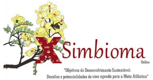
X Simbioma – Simpósio sobre a Biodiversidade da Mata Atlântica - 18 - 21 maio 2021 Link: http://sambio.org.br/simbioma/tol